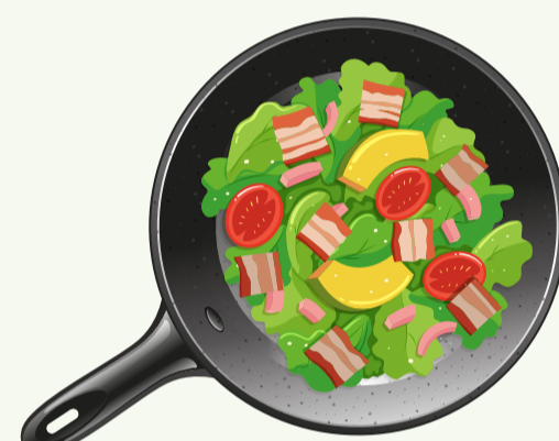
7. Roerbak-/wok-/ stoofgroenten