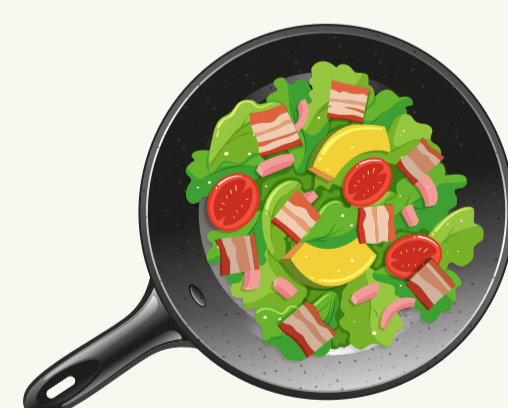
8. Roerbak-/wok-/ stoofgroenten